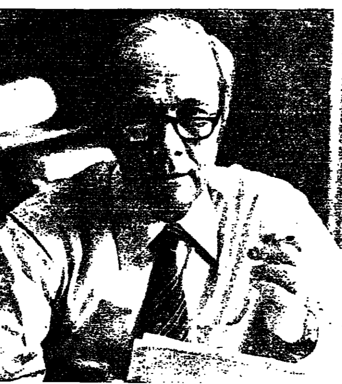
الوزير المساعد وزير الخارجية السورية لشؤون الشرق الأوسط

اعرب ريمون بار رئيس وزراء فرنسا عن قلقه بشأن الموقف في الشرق الأوسط. وصرح بار بذلك أمام ٢٤ عضواً يتكونون من أربعة عشر حزبا سياسيا يمثلون دول السوق الأوروبية المشتركة في البرلمان الأوروبي عندما استقبلهم أمس وعرض معهم القضايا الدولية وفي مقدمتها أزمة الشرق الأوسط. باريس - ر - واس